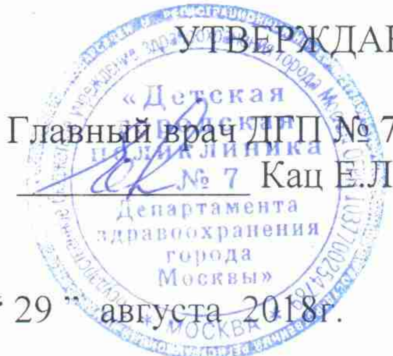
График профилактических медицинских осмотров детей в детских садах (подготовительная группа)