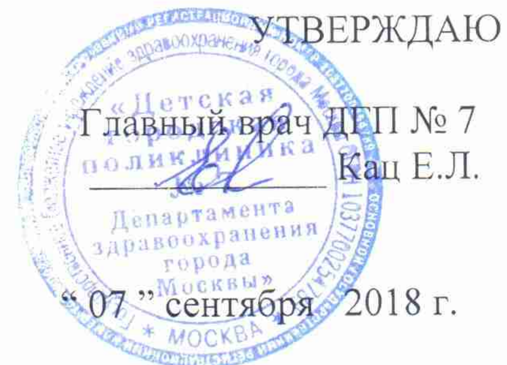
График профилактических медицинских осмотров 10- леток